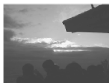
平成23年元旦 鳩取山初日の出