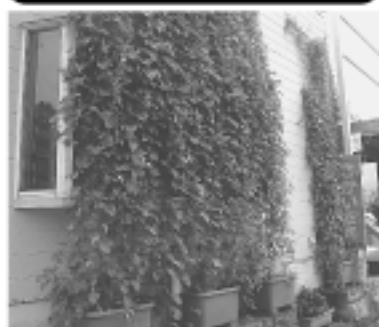
文字通りロハスの窓の我が事務所

1期目議員が副議長に就任するのは極めてまれとのことで、いろいろな事がありました。敢えてお受けしたのは副議長になったら何をしたいかが明確に有ったからです。在任中で驚いたのは議長への出席依頼の多さでした。名誉職と勘違いされているむきが各方面にあり、これでは議会改革どころか議会の空洞化が心配です。多方面に意識改革の御願いの必要性も感じました。今度は建設経済委員長です、既成概念にとらわれずに大役を務めあげたいと思います。