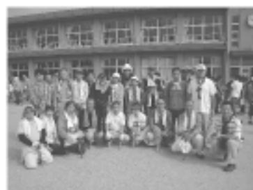
小学校草刈奉仕参加の皆様